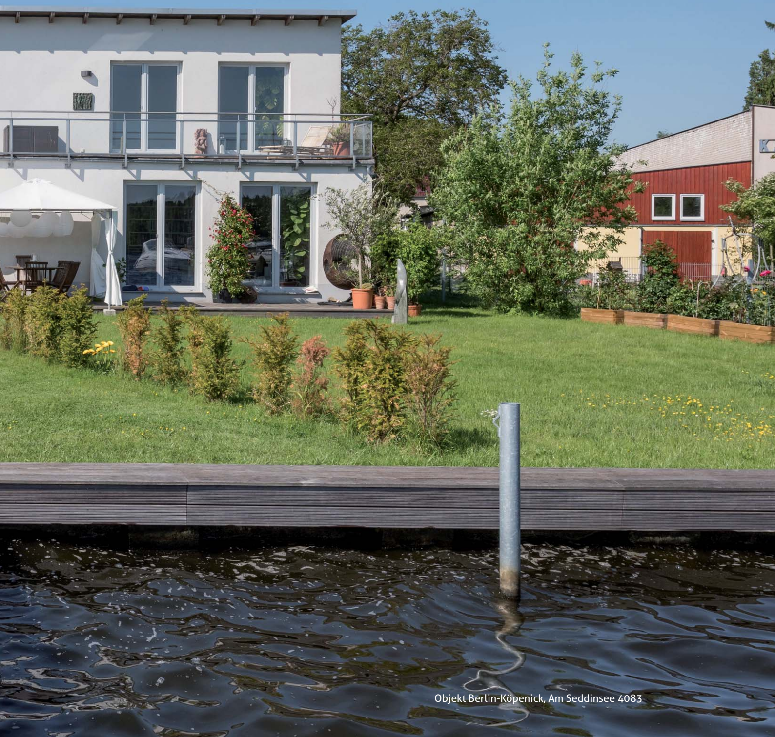
Objekt Berlin-Köpenick, Am Seddinsee 4083