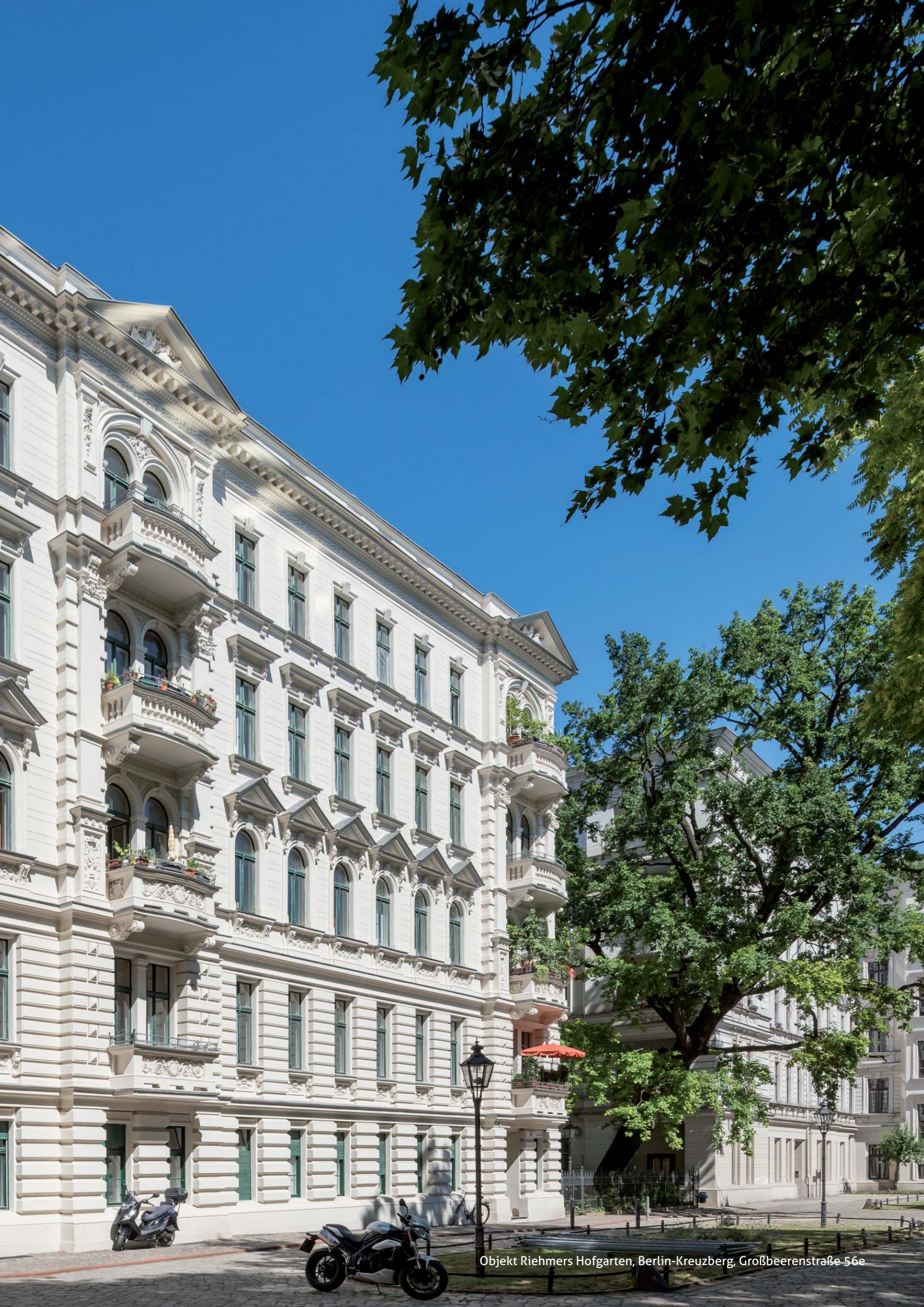
Objekt Riehmers Hofgarten, Berlin-Kreuzberg, Großbeerenstraße 56e