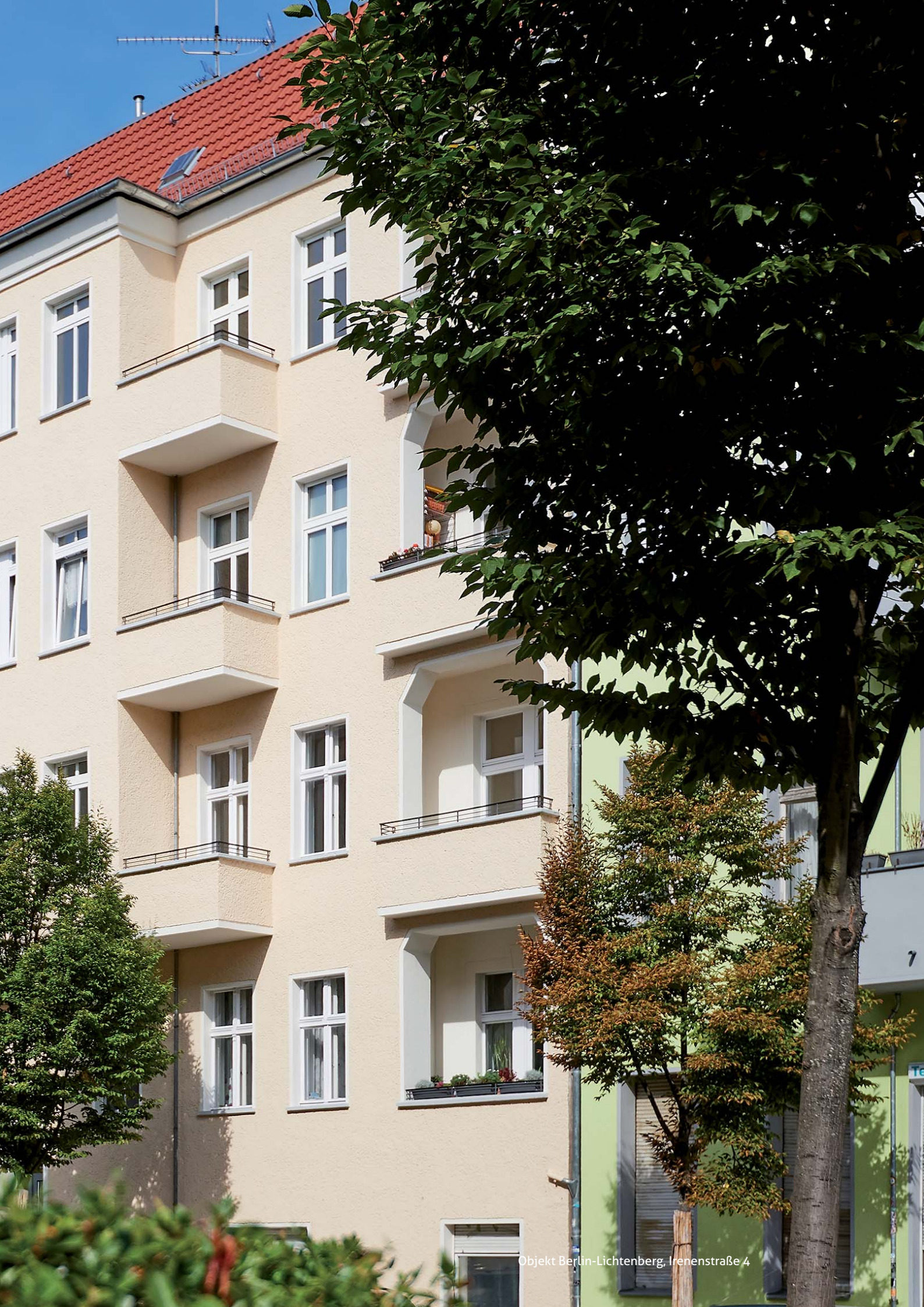
Objekt Berlin-Lichtenberg, Irenenstraße 4